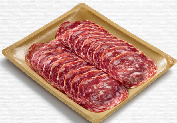
Salame Antica Emilia Salame Antica Emilia