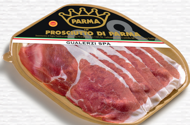
Prosciutto di Parma DOP Prosciutto di Parma PDO