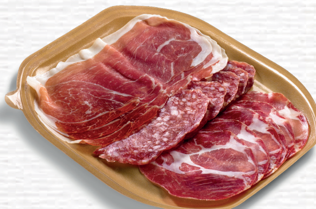
Antipasto Italiano (Prosciutto Parma DOP, Salame Felino IGP, Coppa di Parma IGP) Antipasto Italiano (Prosciutto Parma PDO, Salame Felino PGI, Coppa di Parma PGI)