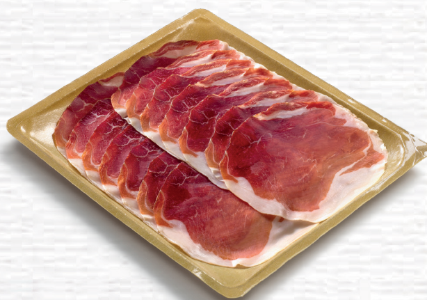
Fiocco di Prosciutto Fiocco di Prosciutto