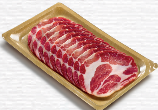
Coppa di Parma IGP Coppa di Parma PGI